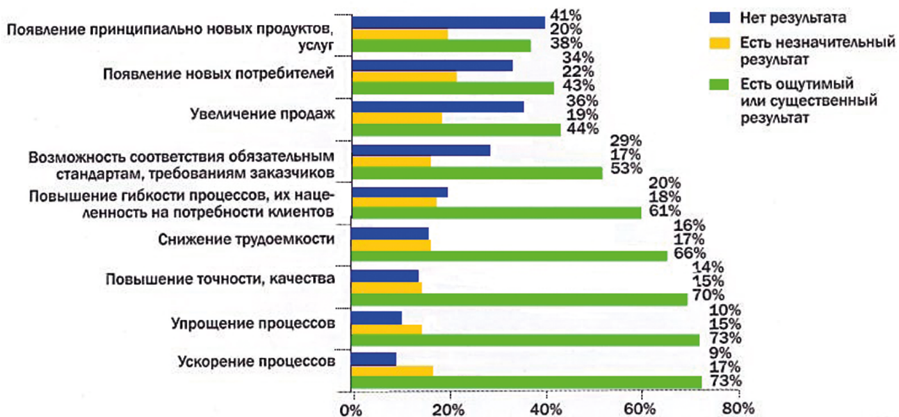
Рис. 7. Ожидаемые результаты (по материалам НИУ «Высшая школа экономики»)

Примечание.