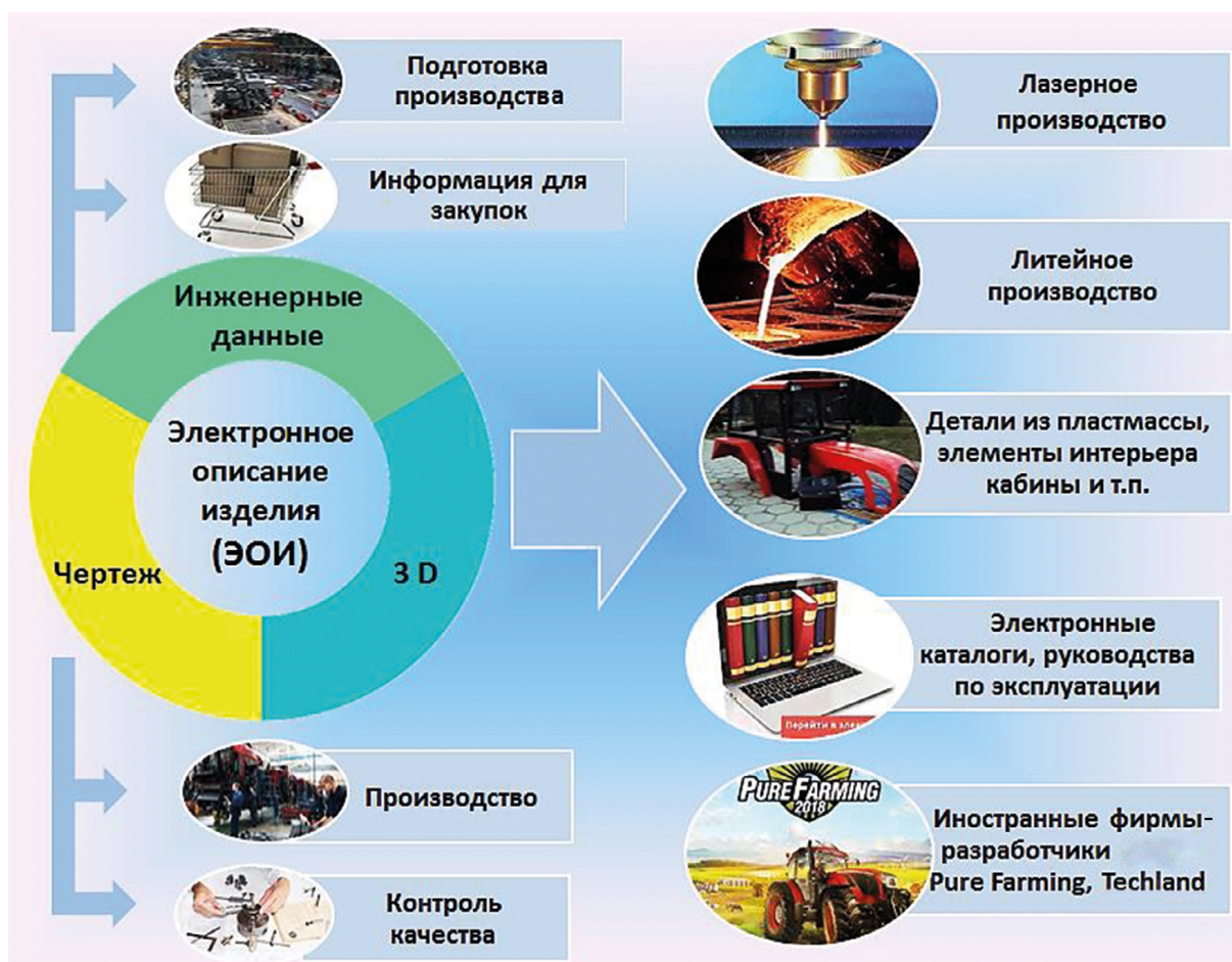
Рис. 2. Модель цифровой системы управления производством

Однако для успешного процесса разработки новых изделий применение современной программы 3D-проектирования Creo 2.0 недостаточно. Необходимо, используя все преимущества работы в едином информационном пространстве, обеспечить четкую организацию совместного труда большой группы конструкторов, разработчиков, проектировщиков, компоновщиков, расчетчиков. Слаженная и стабильная командная работа с четким разделением функциональности позволит в конечном итоге реализовать цели НТЦК ОАО «Гомсельмаш» по переходу на единую систему Windchill.