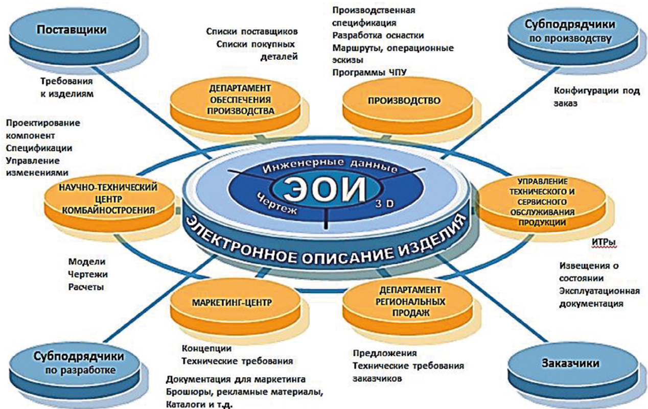
Рис. 6. 3D-модель — главный источник информации об изделии Примечание. Источник: собственная разработка Fig. 6. 3D-model is the main information source about the product Note. Source: own development

компьютерной техникой, которая позволит напрямую работать с электронными 3D-моделями ДСЕ.