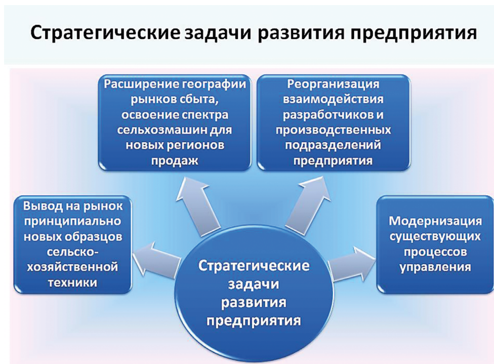
Рис. 1. Стратегические задачи развития предприятия

Четвертая индустриальная революция, получившая название «Индустрия 4.0», обусловлена масштабным развитием мобильных систем телекоммуникаций, «всеобщего интернета» (Internet