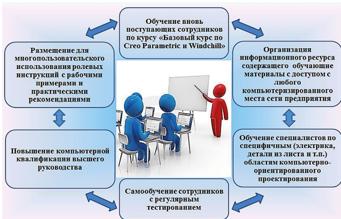
Рис. 4. Мероприятия по повышению квалификации сотрудников в масштабах предприятия

Примечание. Источник: собственная разработка