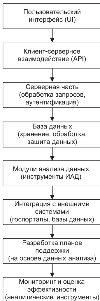
Рис. 3. Схема информационной системы для трудоустройства социально уязвимых групп Fig. 3. Scheme of an information system for employment of socially vulnerable groups

Представленная на рис. 3 схема информационной системы демонстрирует, как перечисленные методы могут быть интегрированы в процесс поддержки социально уязвимых групп, делая охват от идентификации и анализа потребностей до мониторинга и оценки реализованных стратегий.